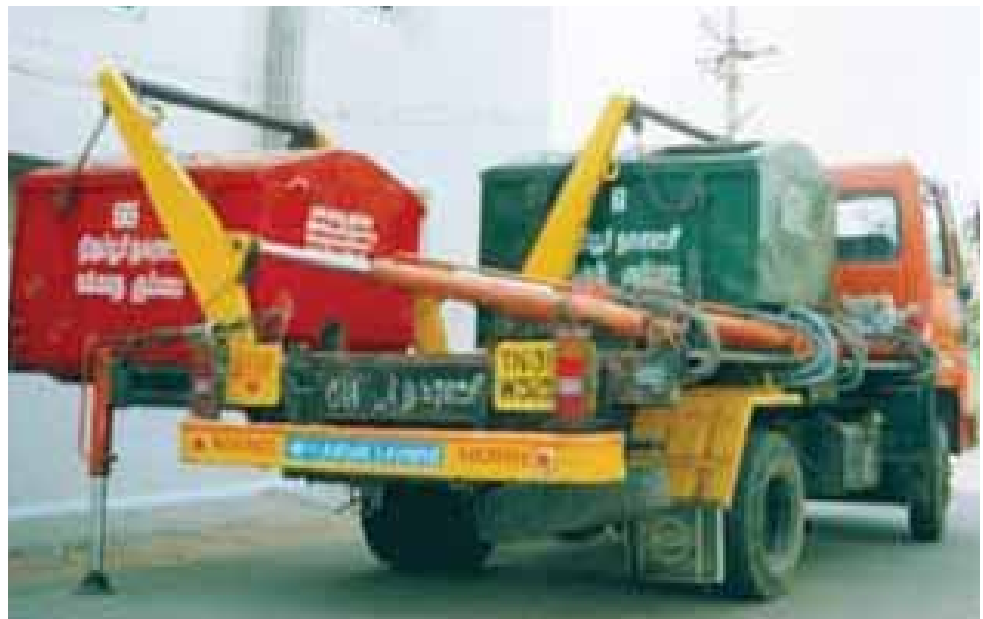
Figure 2.13: Skip Truck (Dumper Placer Machines) 17