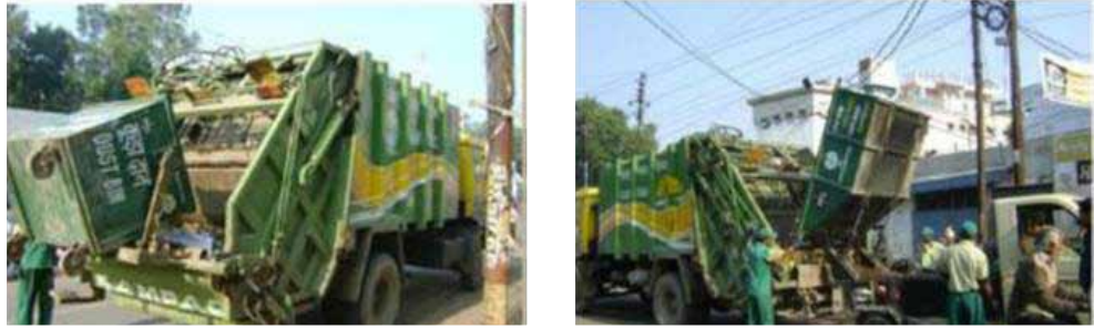
Figure 2.15: Transfer of Waste from Secondary Collection Bins to Refuse Compactor 19