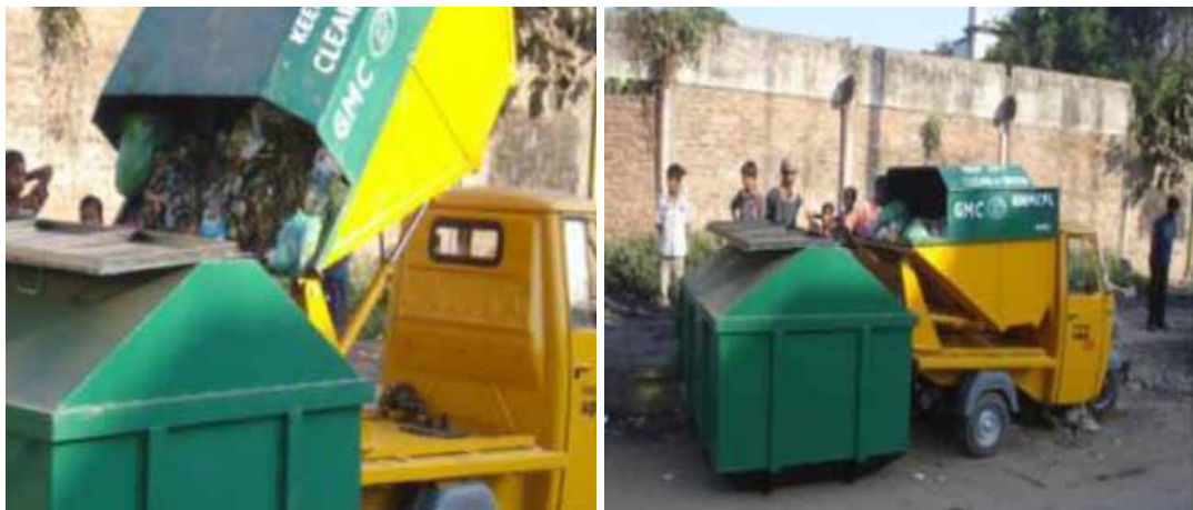
Figure 2.12: Synchronised Primary Collection and Secondary Storage 16

Being unhygienic, cement concrete bins, masonry bins, and dhalaos are being replaced by metal containers. In general, waste storage containers should be covered and designed to facilitate mechanical lifting to avoid multiple handling and environmental harm. It is necessary to wash community bins at regular intervals to ensure a healthy and hygienic environment for users and workers. The design of waste storage containers or depots (secondary collection points) should be synchronous with the design of vehicles deployed for both primary and secondary waste collection (Figure 2.12).