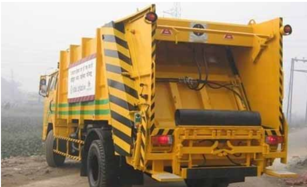
Figure 2.14: Medium Size Compactor Truck 18